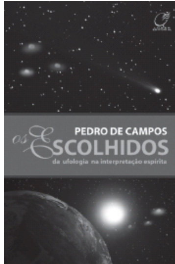
OS ESCOLHIDOS da ufologia na interpretação espírita