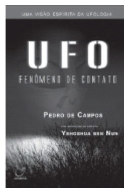
UFO - FENÔMENO DE CONTATO (espírito Yehoshua ben Nun )