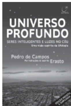
UNIVERSO PROFUNDO Seres inteligentes e luzes no céu (espírito Erasto)