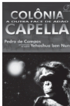
COLÔNIA CAPELLA A outra face de Adão (espírito Yehoshua ben Nun)